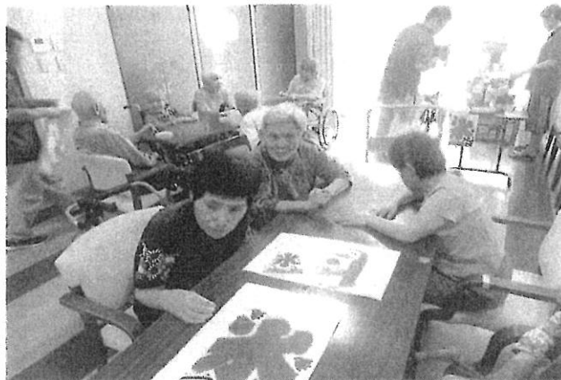
4 8月22日(水) つばめ・みずほ合同 かき氷大会