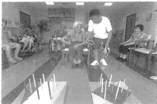
7月15日(日) 輪投げ大会