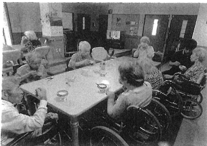
7月 誕生会&パフェ作り