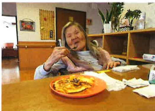
11月 ホットケーキ作り