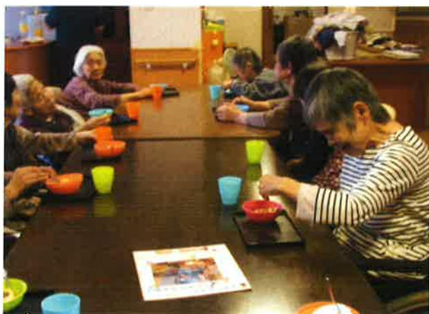
11月18日(水) 誕生会&茶話会