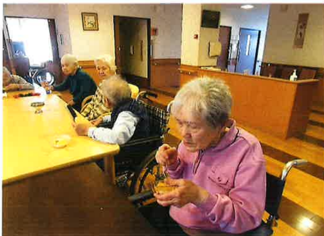
11月 誕生会&フルーツヨーグルト作り