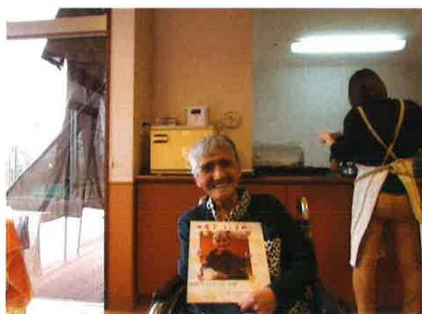
12月21日(金) 忘年会&誕生会